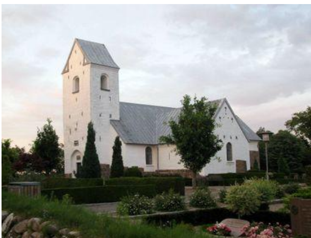
Horsens kirke i Langholt by